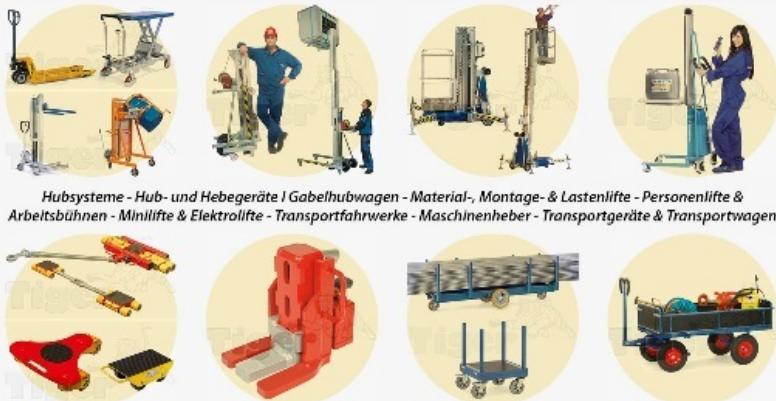
Hubsysteme - Hub- und Hebegeräte | Gabelhubwagen - Material-, Montage- & Lastenlifte - Personenlifte & Arbeitsbühnen - Minilifte & Elektrolifte - Transportfahrwerke - Maschinenheber - Transportgeräte & Transportwagen