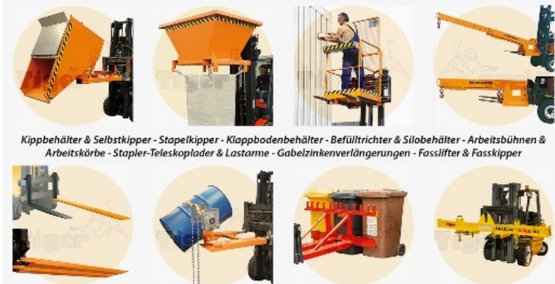
Kippbehälter & Selbstkipper - Stapelkipper - Klappbodenbehälter - Befülltrichter & Silobehälter - Arbeitsbühnen & Arbeitskörbe - Stapler-Teleskoplader & Lastarme - Gabelzinkenverlängerungen - Fasslifter & Fasskipper