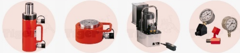
Hydraulikzylinder | Zug- und Druckzylinder - Hydraulische Hand- & Elektropumpen - Hydraulikzubehör - Hydraulische Werkzeuge - Werkstattpressen - Hydraulische Hebezeug-Prüfstände - Hydraulische Heber