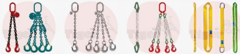
Anschlagketten & Kettengehänge - Edelstahlketten - Rundschlingengehänge - Hebebänder & Rundschlingen - Zurrgurte & Zurrketten - Anschlagpunkte - Anschweißhaken - Automatlkhaken - Anschlagmittelgarderobe