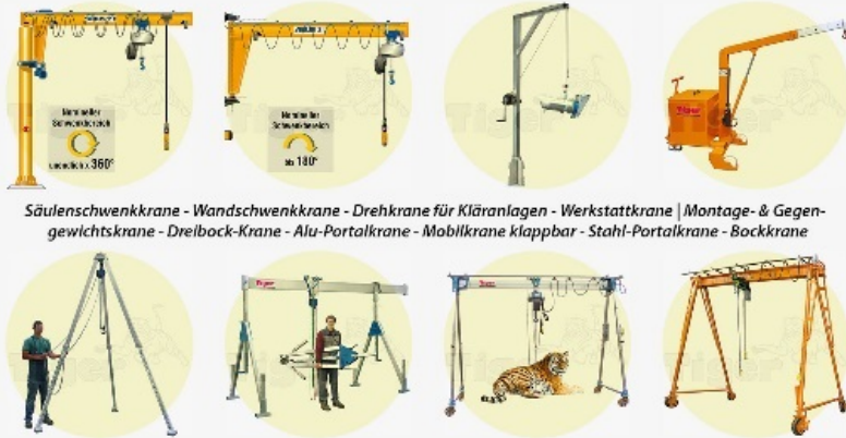
Säulenschwenkkrane - Wandschwenkkrane - Drehkrane für Kläranlagen - Werkstattkrane | Montage- & Gegengewichtskrane - Dreibock-Krane - Alu-Portalkrane - Mobilkrane klappbar - Stahl-Portalkrane - Bockkrane