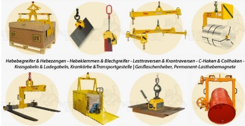
Hebebegreifer & Hebezangen - Hebeklemmen & Blechgreifer - Lasttraversen & Krantraversen - C-Haken & Coilhaken - Krankörbe & Ladegabeln, Krankörbe & Transportgestelle | Gasflaschenheber, Permanent-Lasthebemagnete