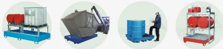
Auffangwannen aus Stahl & PE-Kunststoff für Fässer - Containerwannen - Kleingebindewannen & Regale - Gefahrstofflager & Depots für Fässer - Gefahrstoffcontainer - Gasflaschenlagerung - Fass- & Mülltonnenheber