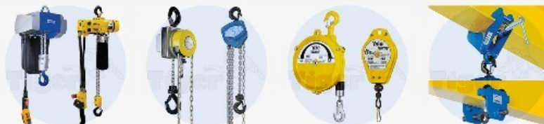
Elektrokettenzüge - Stirnradflaschenzüge - Handseilzüge - Balancer & Seilfederzüge - Trägerklemmen & Roll-Fahrwerke - Hebelzüge - Kranhakenwaagen - Hand- & Elektroseilwinden - Seilrollen - Stahl- & Zahnstangenwinden